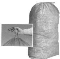
Zuzieh-Müllsack HDPE 120 Liter