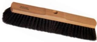
2 Rosshaarmischung für feine Böden