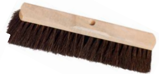
4 Arenga nassfest