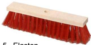
5 Elaston mit Flachholz oder Sattelholz