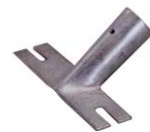
8 Stielhalter 24 cm 28 cm